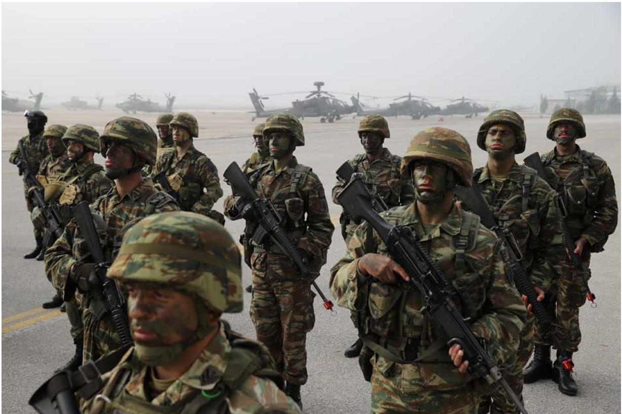
Έλληνες πεζοναύτες σε παράταξη πριν από μια στρατιωτική άσκηση στο Στεφανοβίκιο, στις 19 Φεβρουαρίου του 2020.

προσλήψεων ήταν κυρίως η απόκτηση ημιεπαγγελματιών οπλιτών που θα ήταν αποτελεσματικοί χειριστές των διαρκώς και πιο πολύπλοκων συστημάτων τα οποία εντάσσονταν στις Ελληνικές Ένοπλες Δυνάμεις. Επιπλέον θα ενίσχυαν τον ανεπαρκή αριθμό των μονίμων υπαξιωματικών σε καθήκοντα χαμηλών βαθμοφόρων (πχ ομαδάρχες-αρχηγοί στοιχείων). Η αρχική σκέψη προέβλεπε ότι τα παραπάνω στελέχη, μετά την ολοκλήρωση της σύμβασης διάρκειας 5-7 ετών θα απομακρύνονταν από το στράτευμα (εντασσόμενα ως πολύτιμα στελέχη στην εφεδρεία) και θα αντικαθίσταντο σταδιακά από ανάλογο αριθμό νέων «συμβασιούχων». Στον παραπάνω, ορθό σε γενικές γραμμές, σχεδιασμό, ο αριθμός των εισερχομένων ανά έτος, θα εξαρτάτο από τις πραγματικές ανάγκες, τις οικονομικές δυνατότητες και έναν αριθμό άλλων παραγόντων (πχ. απόδοση κλάσεων).